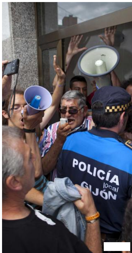
Un grupo de personas trata de impedir un desahucio en Gijón. Juan plaza

El letrado aclara que la respuesta del Gobierno «es una presa para parar una riada de desgracias familiares» que no suspende los procedimientos hipotecarios, sino únicamente los lanzamientos, y que en la exposición de motivos deja la puerta abierta a una reforma legislativa más profunda. Gordillo se dice abiertamente partidario de