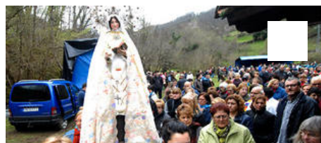
Romería de Piedracea en las fiestas de La Flor de Lena