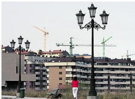
Viviendas en Montecerrao.